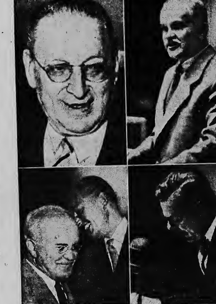
De Chileen Jose Manza (links boven) is gekozen tot president van de tiende algemene vergadering van de Verenigde Naties. Zowel Rusland als Amerika hebben in de eerste dagen vurig gepleit, Molotov (rechts boven) voor toelating van China tot de V.N. en Cabot Lodge (rechts onder) voor uitstel van de behandeling van deze toelatingswedge. Cabot Lodge won het feit. De Britten waren eveneens tegen Molotovs voorstel, hoewel de Britse vertegenwoordiger Nutting het wel met Molotov kon vinden (links onder).

LONDEN, 29 Sept. — De Britse regering zal onverwijld 50.000 pond sterling beschikbaar stellen voor elk der gouvernementen van Barbados en Grenada om de door de recente orkanen veroorzaakte nood te helpen lenigen, aldus heeft het ministerie van koloniën vandaag bekendgemaakt.